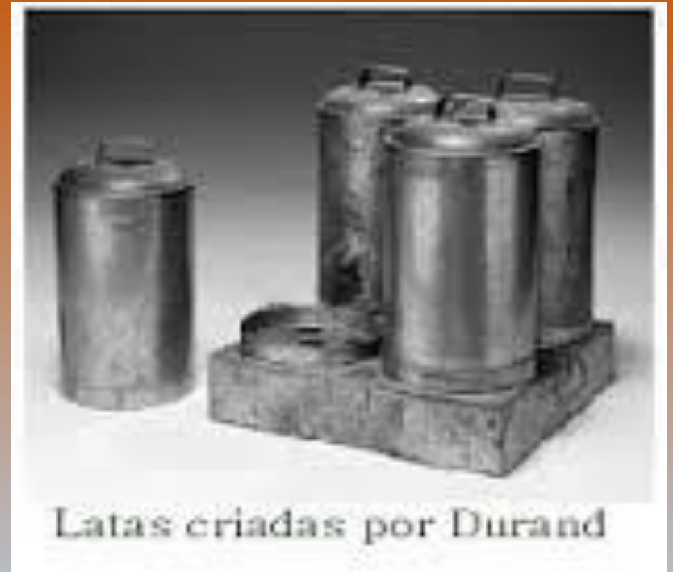
Latas criadas por Durand