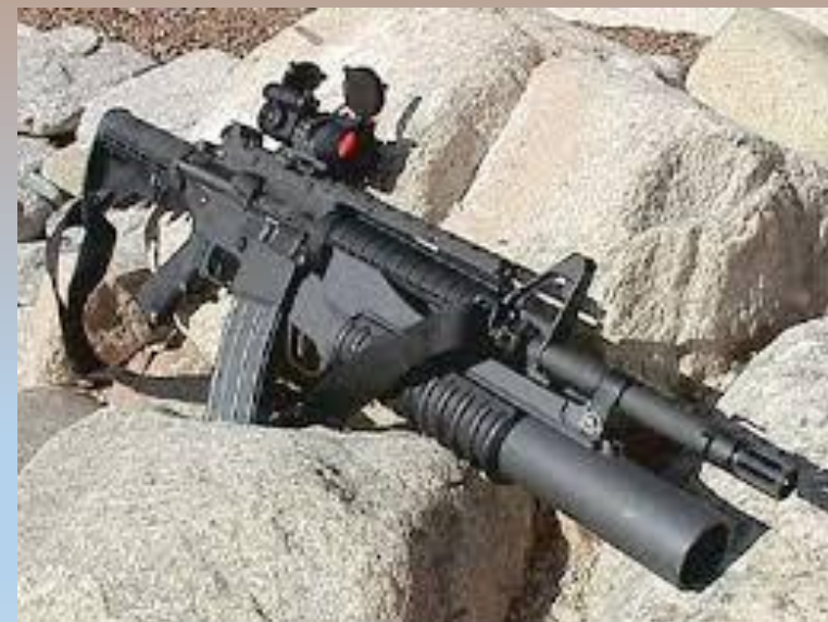
6 - Tanques e metralhadoras