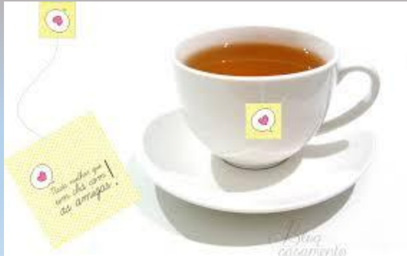
10 - Chá em Saquinhos