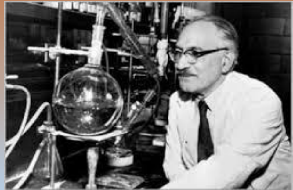
Alexander Fleming em seu laboratório de pesquisas, na Universidade St. Mary's Hospital, em Londres, onde - quase por acaso - descobriu a penicilina