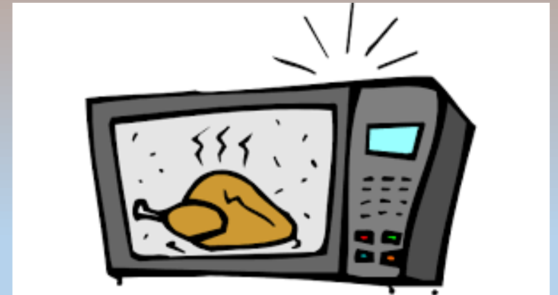
7 – Micro-ondas