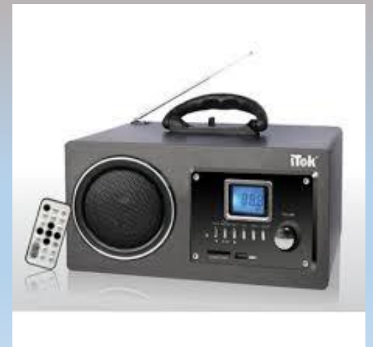
3 -Rádio sem fio